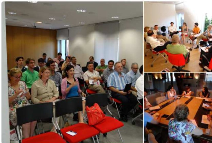
Ilustración 2- TEI Bio Especial fin de curso